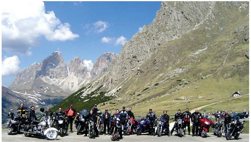
20 begeisterte Motorradfahrer vor der fantastischen Dolomiten-Kulisse!

Der Erfolg hat uns Recht gegeben. Viele tausend